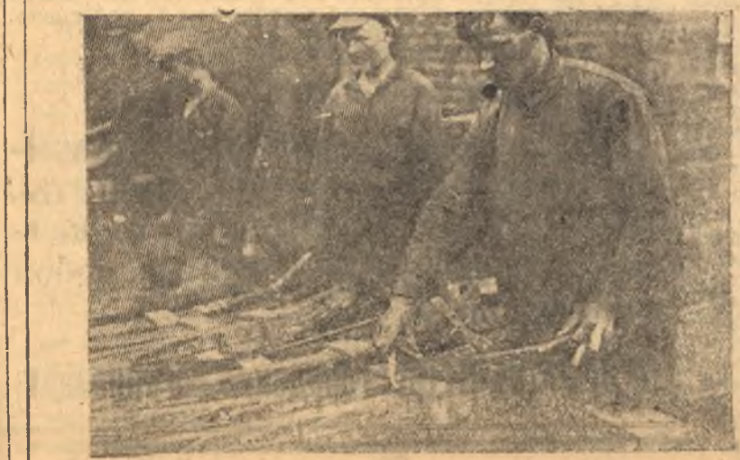
В кузнечном цехе за приемкой рессор.